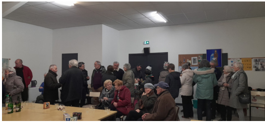
Galette des rois à ND des Apôtres